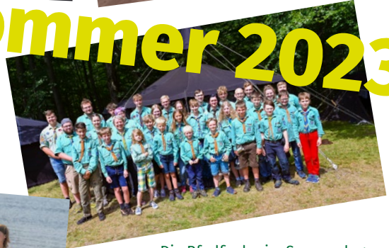
Die Pfadfinder im Sommerlager auf dem Bückeberg