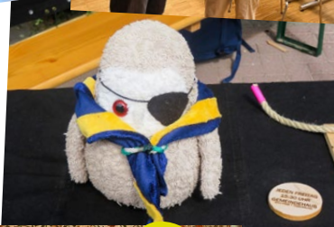
Stand der „Wald- eulen“ Angeln- Süd bei „Böklund on the road“