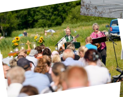
Taufgottesdienst an der Schlei