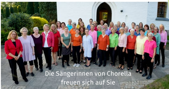
Die Sängerinnen von Chorella freuen sich auf Sie

Sonntag, 12. November um 17 Uhr in St. Marien Kahleby