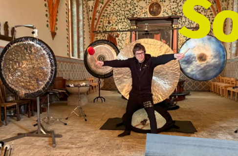
Gong-Konzert in Kahleby