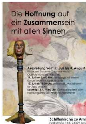
Schifferkirche zu Arnis Parkstraße 118, 24399 Arnis

www.susannegressmann.com www.kasperwerkstatt.de