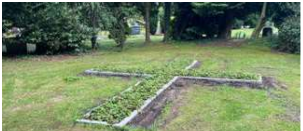
Hier entsteht gerade die neue Gedenkstätte für Sternenkinder auf dem Kappeler Friedhof