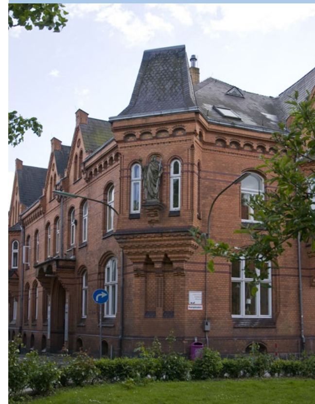
Johanniskirchhof 19-19a, 24937 Flensburg

Tagestreff für wohnungslose Männer und Männer mit Wohnproblemen