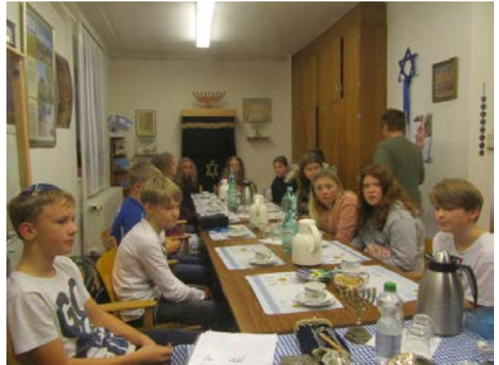
Konfirmanden zu Besuch bei der Jüdischen Gemeinde in Flensburg

Begrüßung im Gottesdienst am 8. September um 10 Uhr. Die Konfirmation am Schluss feiern wir an einem Sonntag nach Ostern 2021.