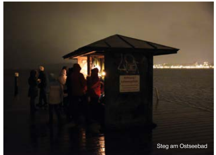
Steg am Ostseebad

Fragen, Neugier, Interesse? Wir laden herzlich ein zu einem planenden Treffen: Dienstag, den 17. September, schon um 18.00 Uhr im Turnerberg 16! Vielleicht haben Sie Interesse, aktiv mit zu machen?