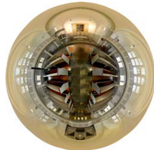
Ein 360° Blick in unsere Kirche

Übrigens hat die Nachwuchsbegleitung der Nordkirche auch einen Instagram-Account: Unter nachwuchsnordkirche kann man im September vermutlich einen Einblick in alle Praktikumsplätze erhalten (jedenfalls war das im letzten Jahr so).