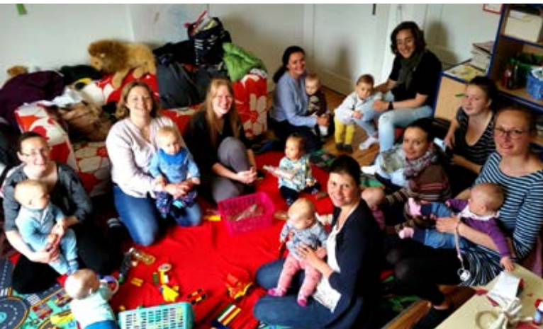
Viele neue Gesichter in der Krabbelgruppe

Wir treffen uns regelmässig jeden Dienstag von 9.30 - 11.00 Uhr . Mütter, Väter und auch Großeltern sind herzlich willkommen mit ihren Kindern im Alter von 0 bis 1½ Jahre zum Basteln, Frühstücken, Fingerspiele einüben oder einfach nur zum Klönen und Erfahrungsaustausch.