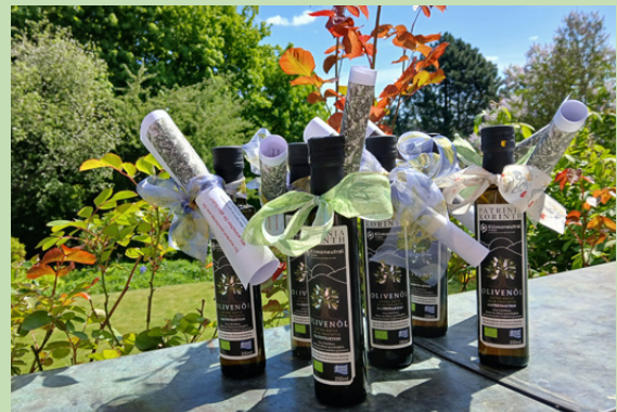
Im Hintergrund ist unser schöner Garten

In Freud und Leid darf das Öl weiterverschenkt werden. Solange der Vorrat reicht. Beim Gartentag am Freitag, 26. September um 15 Uhr probieren wir das Öl. Hat jemand Lust einen Salat vorzubereiten? Für die Salatsoße stellen wir das Öl zur Verfügung. Eine Kostprobe ist möglich!