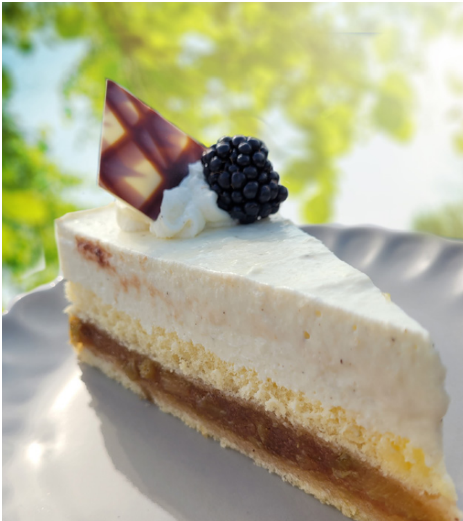
Foto: Sommertorte.

Alle Gastgeber*innen des Lebendigen Advents laden wir zu einem Stück Torte ein. Wir lassen es uns schmecken im Garten am Bethlehem Haus. Wir sprechen die Termine ab. Danke, wenn Ihr wieder dabei seid! Wir backen für Euch.