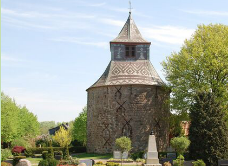
St. Georg Kirche