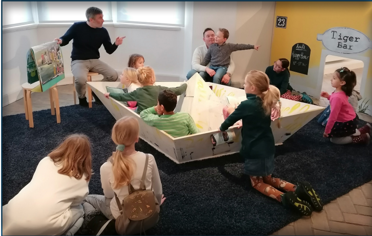
Kinderkirche mal anders: Frosch findet Krone. Besuch am Museumsberg im Januar