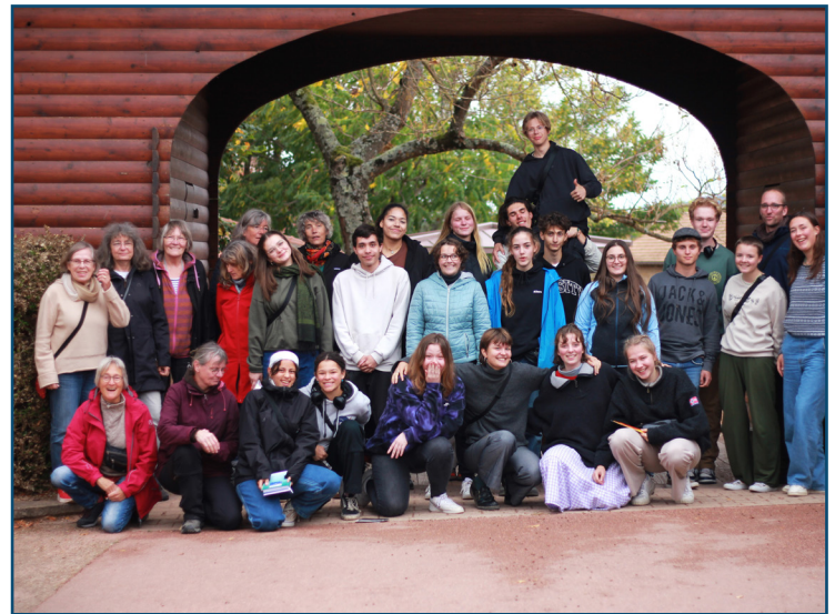
Das sind wir im September 2023 in Taizé