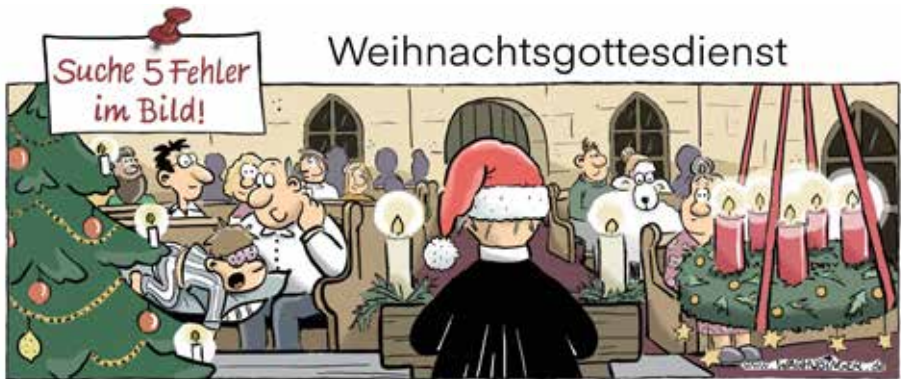
Zitronen, Schlafender, Nikolausmütze, Schaf, fünfte Kerze