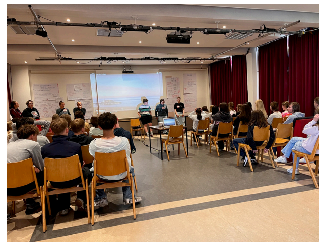
queertalk JuCe, Foto: Bongartz

Vom 11. bis 29. August machen wir Sommerpause und sind dann in der letzten Ferienwoche (02. September) wieder für euch da.