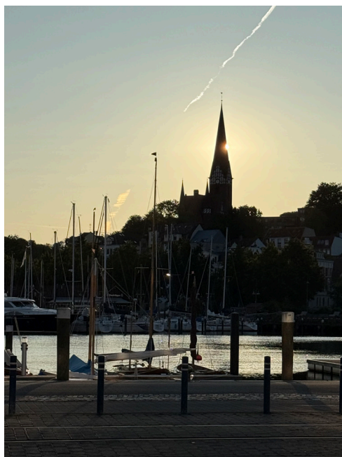
Sonne hinter St. Jürgen

Im März 2025 widmete sich die Deutsche Stiftung Denkmalschutz verstärkt den Sakralbauten und stellte die Frage nach dem Umgang mit ihnen, wenn sie in ihrer "Ursprungsfunktion" heutzutage weniger "gebraucht" würden, weil Mitgliederzahlen sinken. Die Antwort ist interessant, knüpft sie doch eng am ursprünglichen Gebrauch an: "Hier für eine Gesellschaft im Wandel dringend notwendige Räume der Begegnung, der individuellen Einkehr oder des Diskurses und Austauschs zu finden, bietet große Chancen und neue Aufgaben sowohl für Kirchenbauten als auch für die Kirchengemeinschaften. ... Die Kirchenbauten, als Wahrzeichen zentral im Ort gelegen, als besondere Denkmale im Bewusstsein der Menschen verankert, stellen ein großes Potenzial für das Gemeinwesen dar."