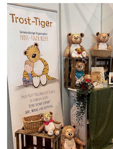
Messe JuCe