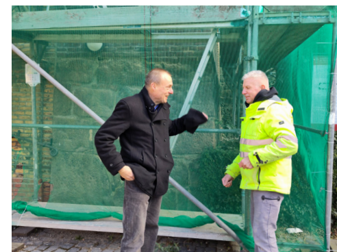
Architekt Garbe und Maurer Fischer bei der Arbeit

cken braucht dringend Zuwendung. Aktuell läuten wir sie schon nicht mehr, um den Schaden nicht noch größer zu machen. Außerdem muss die Läuteanlage dringend erneuert werden.