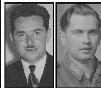
Mein Opa, dein Opa Leseperformance mit Musik