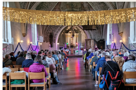
Unten: ABBA-Gottesdienst Links: Ensemble La Flute, Fotos: K. Hecht