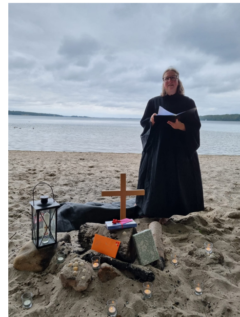
Taufe am Strand, Foto: privat

Ob Jordan, Eider, Treene, das nordfriesische Wattenmeer oder die Flensburger Förde - für eine Taufe sind diese Orte wunderbar geeignet. Das Wasser ist das wesentliche Element, das wichtigste Taufsymbold. Und davon haben wir in Flensburg, zwischen Ostseebad und Quellental, wirklich reichlich. Barfuß am Strand, der weite Himmel über allem, viel Luft und Raum und Licht und Freiheit, und das Wasser ganz nah... Könnte es einen schöneren Ort für eine Taufe, für den Empfang von Gottes Segen zu Beginn des Lebens geben? Pastorin Fiedler feierte kürzlich mit einer jungen Familie am Strand und erinnert sich voller Freude und Dankbarkeit an diese schöne Zeremonie. - Bitte sprechen Sie die Pastorinnen an oder schreiben an das Gemeindebüro, wenn auch Sie an einer Strandtaufe für sich oder Ihr Kind interessiert sind. (kh)