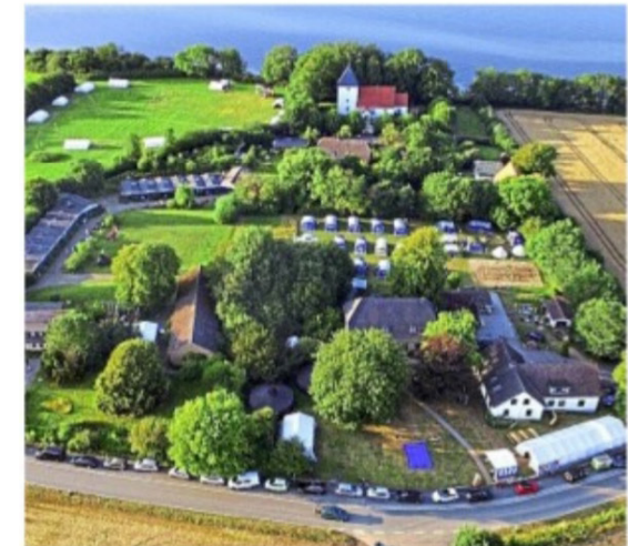
Gemeinschaft und Spiritualität am Strand: In Neukirchen wird eine Taizé-Woche angeboten.

Andachten mit den typischen Taizé – Gesängen und Bibelgesprächskreise wechseln sich täglich ab mit Angeboten zu Freizeit und Erholung. Gemeinsam werden