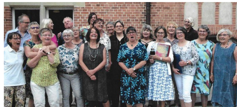
Die Popsingers