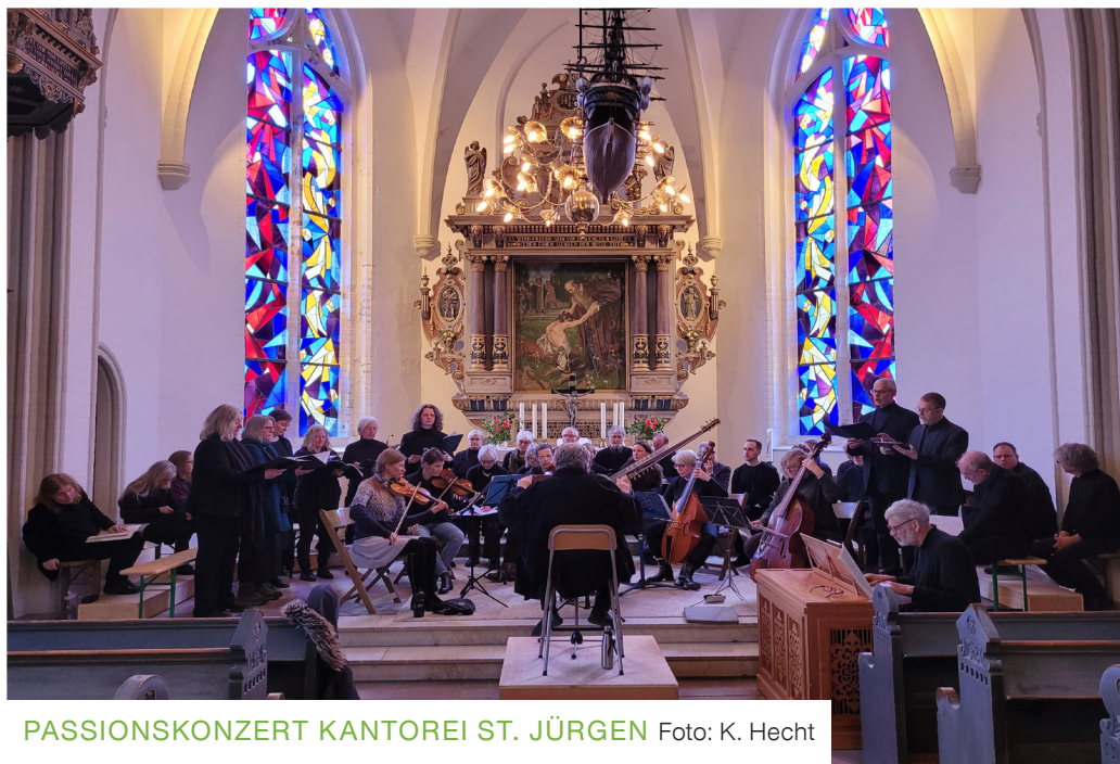
PASSIONSKONZERT KANTOREI ST. JÜRGEN