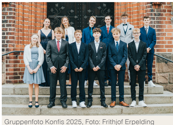
Gruppenfoto Konfis 2025, Foto: Frithjof Erpelding

Ich glaube, dass Jesus der Sohn Gottes ist.